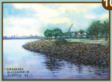
鵬灣跨海大橋 藝術家 林懿聳