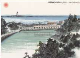
映霞橋亭 藝術家 程代勤 | 水墨紙本