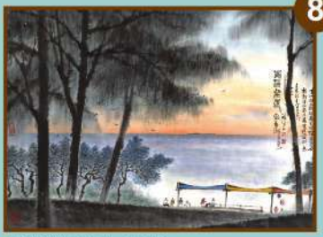
青洲灣 藝術家 林章湖