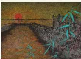
落日灣 藝術家 李振明 | 水墨紙本