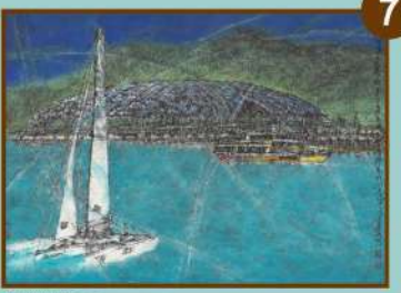
濱灣碼頭 藝術家 李振明