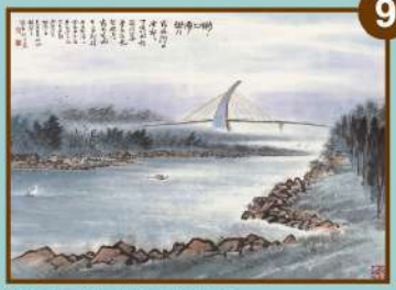
潮口平台 藝術家 林章湖