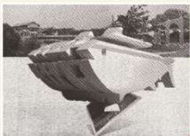
大鵬灣遊客中心 藝術家 林俊良 | 版畫