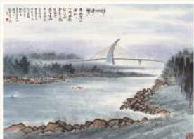
潮口平台 藝術家 林華湖 | 水墨紙本