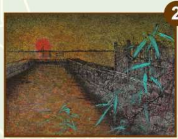
落日灣 藝術家 李振明