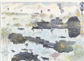
崎峰濕地公園 藝術家 盧明德 | 複合媒材