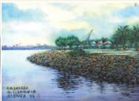
鵬灣跨海大橋 藝術家 林錦聲 | 水墨紙本