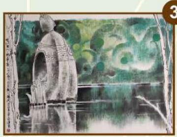
鵬村濕地公園 藝術家 莊連東