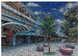
林邊車站 藝術家 李德勤 | 馬賽克磁磚