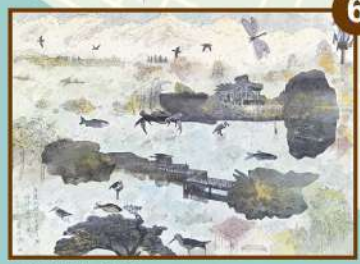
崎峰濕地公園 藝術家 盧明德