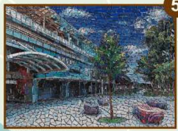
林邊車站 藝術家 李億勳