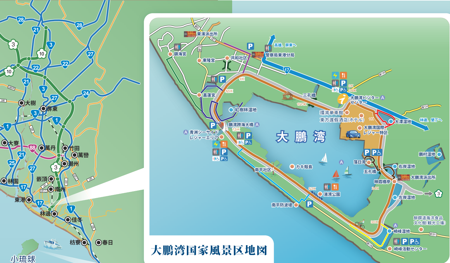
大鵬湾国家風景区地図