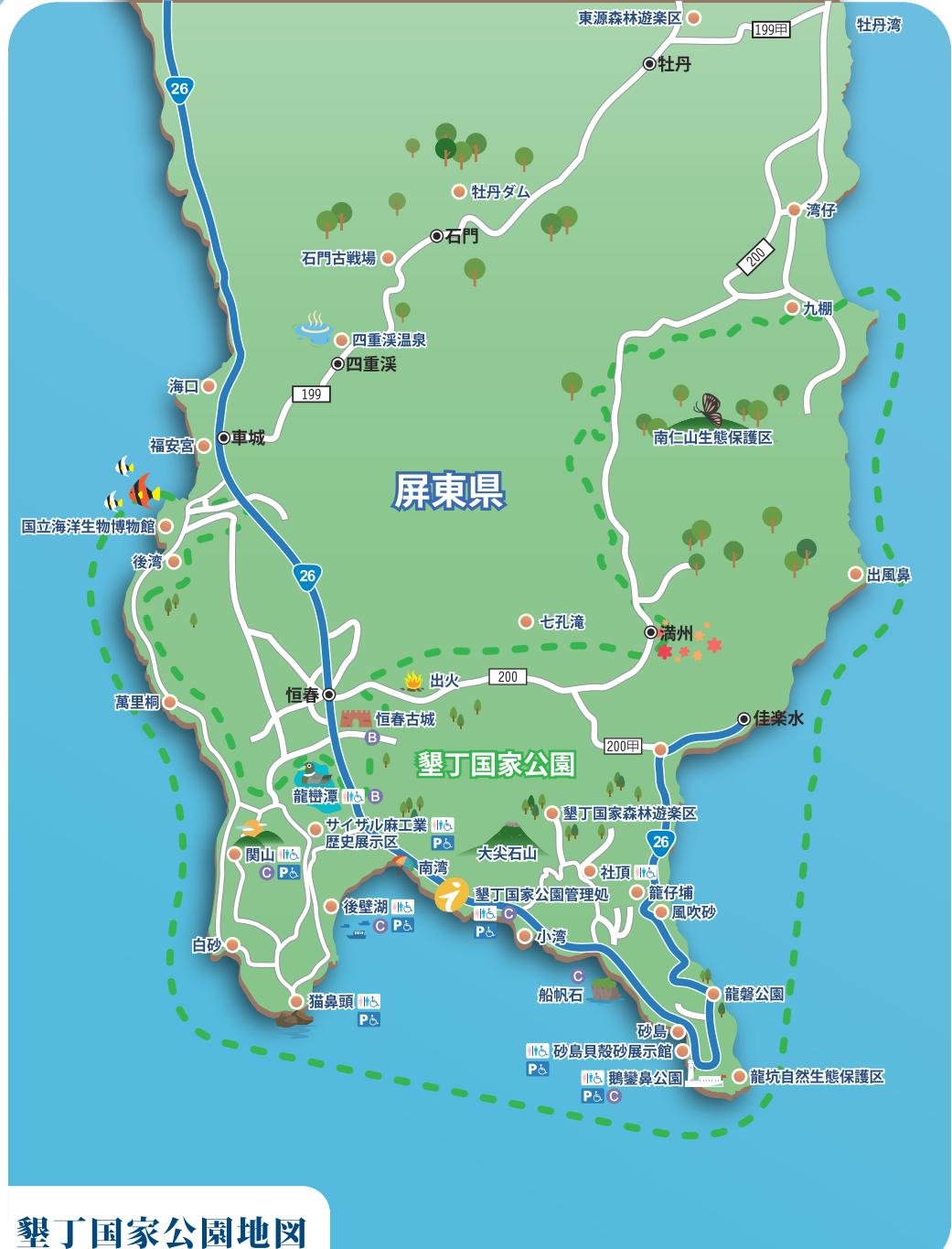
墾丁国家公园地図