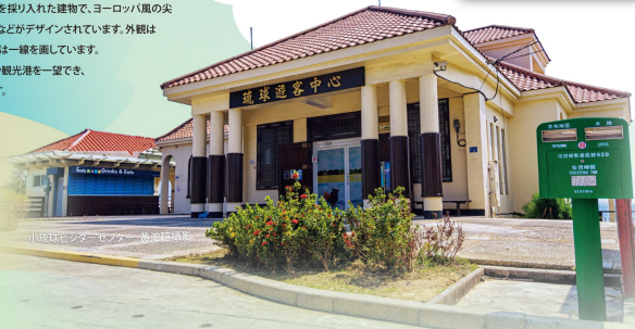
小琉球ビジターセンター 高麗石撮影