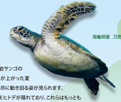
海亀明星 刀用

小琉球のサンゴ資源は非常に豊かで、若くサンゴの種類だけでも200種あまりあります。雨が上がった夏の夜には、岩の裏にイソノガイが縦横無尽に動く回遊姿が見られます。浅瀬の岩陰にはナガウコとウツクモヒトデが隠れており、これらはもともと優美な陸産動物です。また、小琉球はアオウミガメの生息地にも非常に豊かです。美人洞の望海亭を訪れると、アオウミガメの姿を見られるかもしれません！