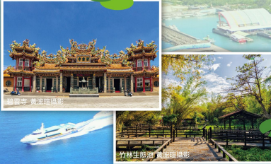
竹林生態池

碧雲寺は島全体における信仰の中心となっています。1736年に建立され、主にお釈迦菩薩を祀っています。村人たちは結婚式の日取りなど、生活における雑事もすべて、ここに來て観音菩薩にお伺いを立てます。碧雲寺の前には木造の棧橋が延びており、竹林や自然湿地の間を散策できます。木漏れ日が差し込む中、清々しい気持ちになれるはずです。夜になるとライトが点きはじめ、蛙の鳴き声を聞きながら優雅な雰囲気を楽しむことができます。