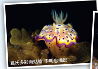
呂氏多彩海綿類