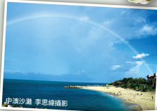
中澳ビーチ

ここは白いサンゴ礁と貝殻の細いウズでできた砂浜です。シュノーケリングや水遊びなど、さまざまなマリンスポーツを楽しめます。また、三年に一度の「迎王平安祭典」の際には、ここで船を水に入れる儀式と船を焼く儀式が行われます。