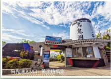
烏鬼洞入り口