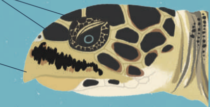
玳瑁 Hawksbill turtle