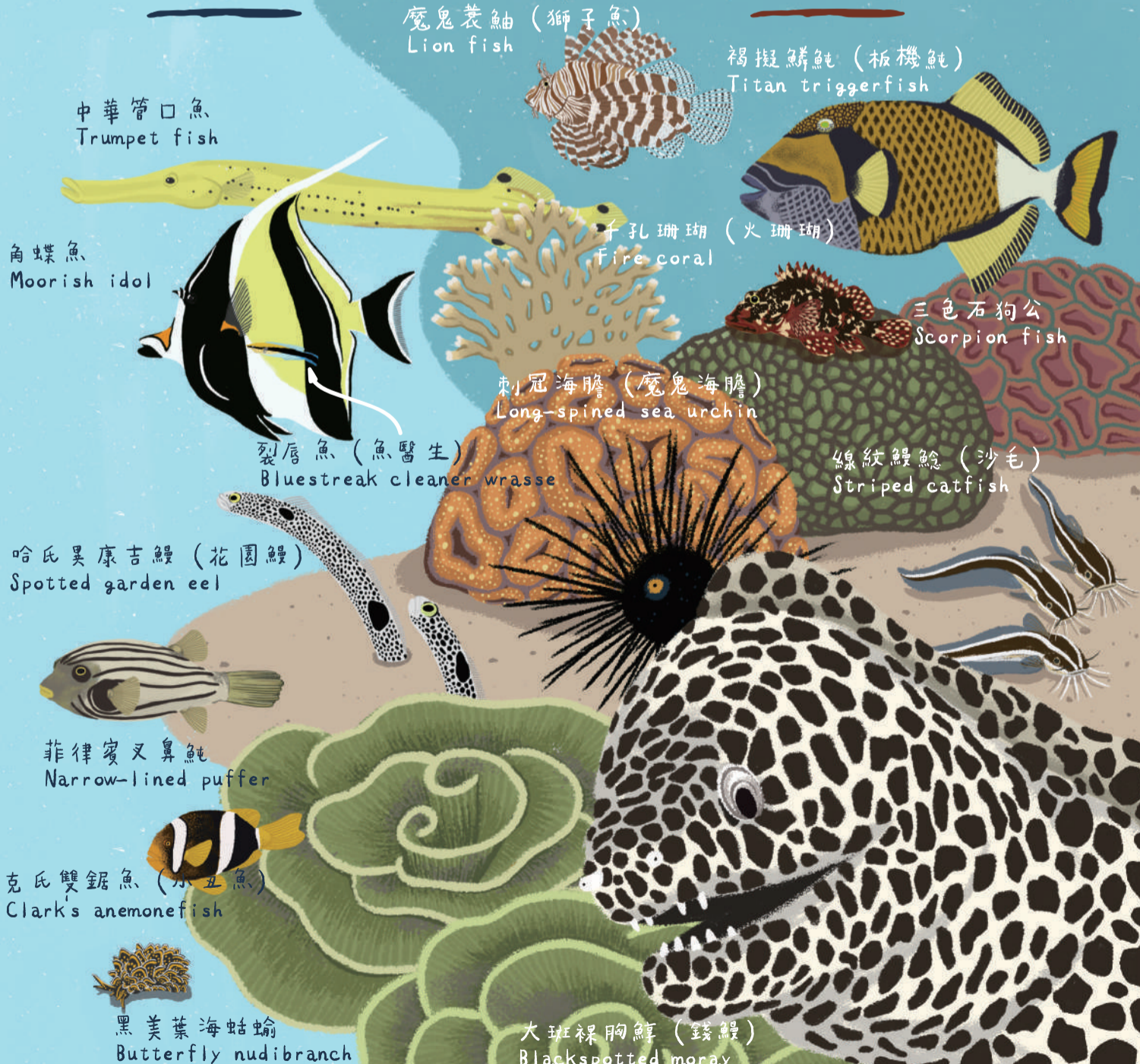
魔鬼蓑鮋 (獅子魚) Lion fish