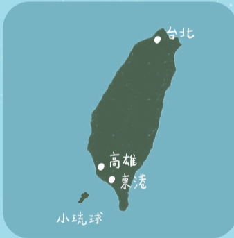
台灣 & 小琉球地理位置圖

小琉球位在台灣西南方外海，四季氣候宜人。夏季高溫多雨，以潛水旅遊而言，較易受到西南氣流、梅雨鋒面以及颱風影響，海況及水下能見度較不穩定。冬季則因台灣本島中央山脈屏障，較不受冬天的東北季風影響，海況較為穩定。