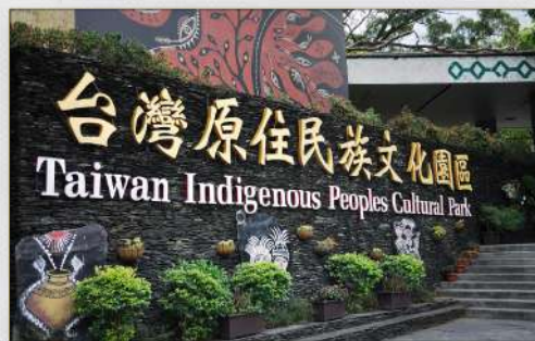
台灣原住民族文化園區