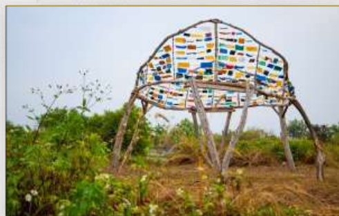
南平半島海漂藝術裝置